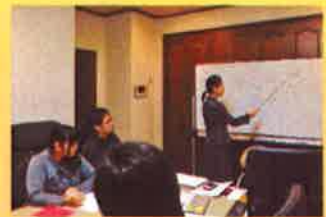
(10月の様子。高野管理者が講師で“接遇とマナー”を行った。)